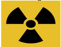
Radiācijas bīstamības simbols