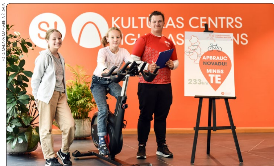
Jau tradicionāli ik gadu Siguldas novadā norisinās Veselības dienas. Šis gads bija īpašs, jo pēc divu gadu pārtraukuma Veselības dienas notika klātienē, piedāvājot bezmaksas lekcijas, veselības pārbaudes un dažādu ārstu konsultācijas. Vēl šogad norisinājās īpaša akcija "Apbrauc apkārt Siguldas novadam!", kopumā dalībnieki veica 589,86 kilometrus, kas nozīmē, ka tie 2,5 reizes apbrauca apkārt Siguldas novadam.