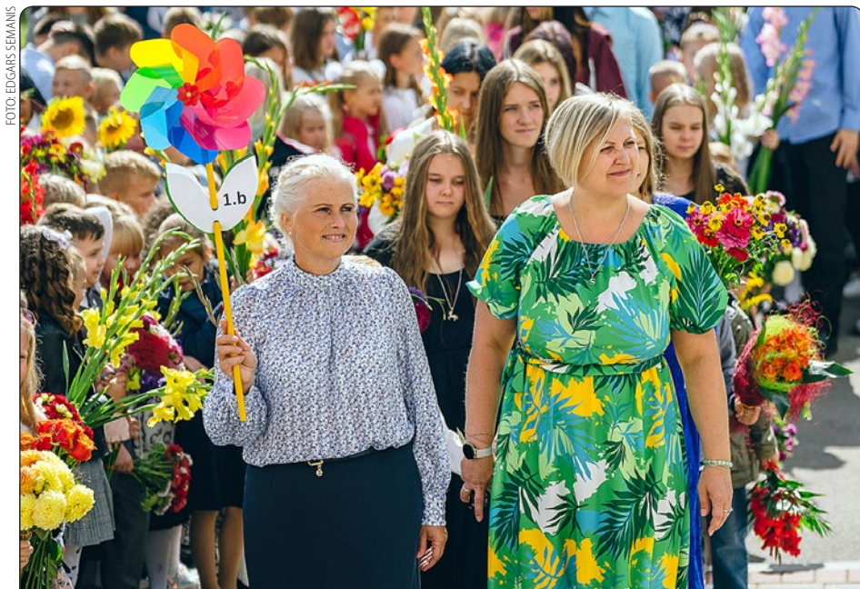
Jaunajā mācību gadā Siguldas novada pašvaldības izglītības iestādes uzņēma 5800 audzēkņus, no kuriem vairāk nekā 400 bērniem šis ir pirmais mācību gads skolā. Šogad mācības 9. klasē uzsāka 367 skolēni, 12. klasē – 137 skolēni. Plašāka informācija – 4. lappusē.