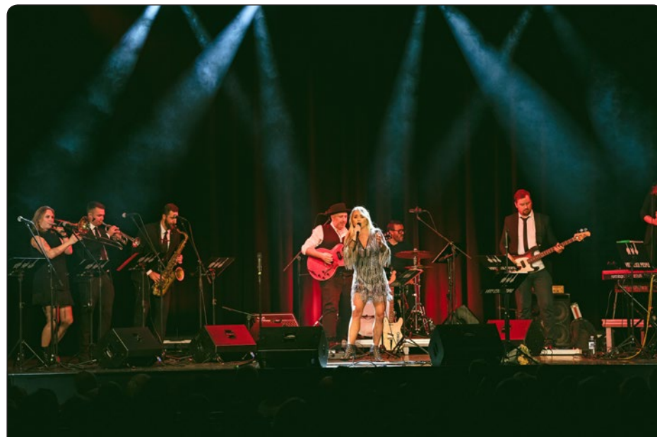
Ar vērienīgiem un spilgtiem pasākumiem septembra sākumā tika atklāta kultūras centra "Siguldas devons" piektā sezona. Arī šī sezona pasākumu apmeklētājiem sniegs iespēju daudzveidīgi atpūsties un gūt iedvesmu dažādos pasākumos. Aicinām sekot līdzi informācijai par aktuālajiem kultūras pasākumiem tīmekļa vietnē www.sigulda.lv .