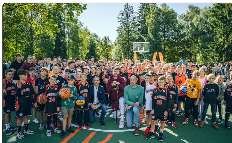
Septembra sākumā Siguldā, Raiņa parkā, tika atklāts mūsdienīgs basketbola laukums, kas tapis, pateicoties Latvijas izlases basketbolista Dāvja Bertāna dāvinājumam. Basketbola laukuma atjaunošana ir pirmais solis no vērienīgā Raiņa parka atdzimšanas plāna, ko īstēnos tuvāko gadu laikā. Nākamais solis būs velotrases ( pump track ) un skeitparka būvniecības pabeigšana.