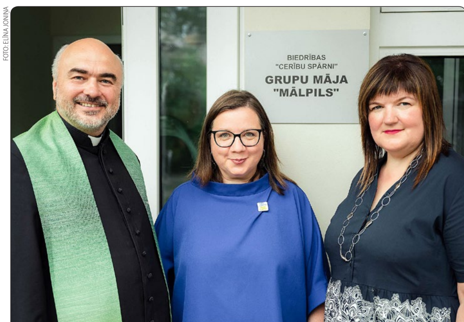
Augusta beigās Mālpilī tika atklāts biedrības "Cerību spārni" jaunizveidotais dienas aprūpes centrs, grupu māja un vieta, kur saņemt "atelpas brīža" pakalpojumus cilvēkiem ar garīga rakstura traucējumiem. Pakalpojumi pieejami Mālpilī, Pils ielā 12 un Pils ielā 7. Plašāka informācija 10. lappusē.