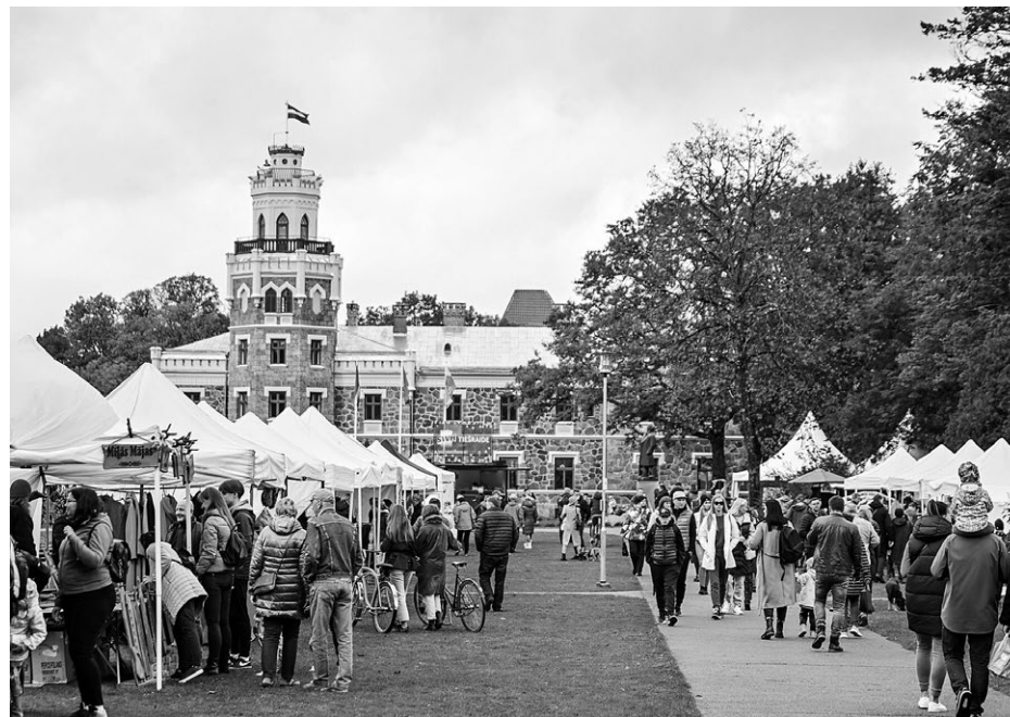
Zelta rudens karalistes svētku norises spēs iepriecināt ikkatru – gan lielu, gan mazu, gan novadnieku, gan novada viesi.

Lai arī strauji pildās gan tirgotāju, gan ēdinātāju rindas, novadnieku dalību tirdziņā gaidām jo īpaši, tādēļ aicinām pieteikties, rakstot uz e-pasta adresi dace.plesa@sigulda.lv.