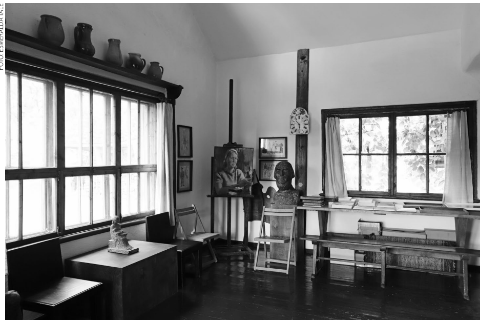
"Skulmju" mājas pirmajā stāvā iekārtota tēlnieces Martas Skulmes un gleznotāja Otto Skulmes piemiņas istaba, kurā aplūkojamas abu mākslinieku piemiņas lietas un Martas Skulmes darinātās skulptūras.