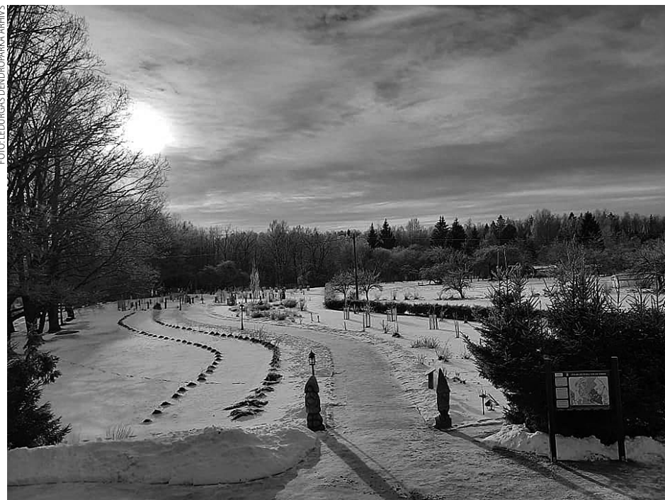
Šogad novērtējumu “Gājējiem draudzīgs” saņēma Lēdurgas dendroparks, bet pērn tas piešķirts arī Siguldas novada Tūrisma informācijas centram Siguldā, Ausekļa ielā 6, tūrisma informācijas centram “Gūtmaņala”, kā arī Krimuldas muižai un kempingam “Siguldas pludmale”. Kopumā kājāmgājējiem draudzīgu viesmīlību šobrīd ir iespējams izbaudīt jau 190 “Gājējam draudzīgos” uzņēmumos visā Latvijā.

Plašāk par Lēdurgas dendroparku un tajā pieejamajiem pakalpojumiem var uzzināt parka tīmekļa vietnē www.ledurgasdendroparks.lv .