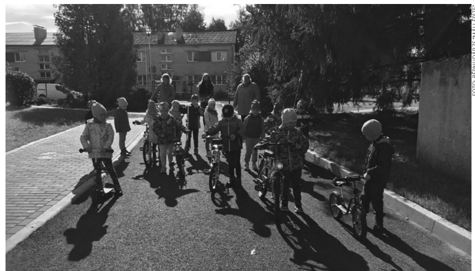
Jaunie braucamrīki un skrejriteņi palīdz dažādot audzēkņu ārā pavadīto laiku, kā arī apgūt jaunas iemaņas – braukt ar velosipēdu vai skrejriteņiem.