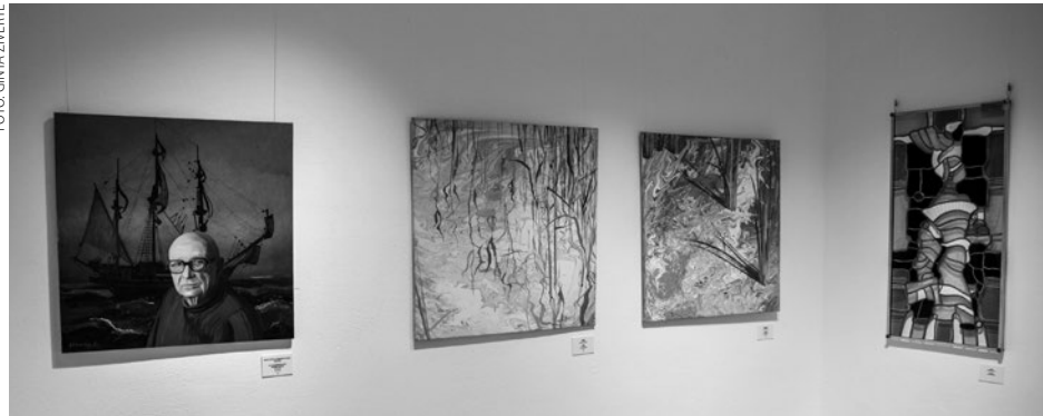
Plānots, ka Inčukalna mākslinieku kopas dalībnieku izstādi "Emocijas", tiklīdz to atļaus epidemioloģiskā situācija, varēs apskatīt arī Inčukalna Tautas namā.