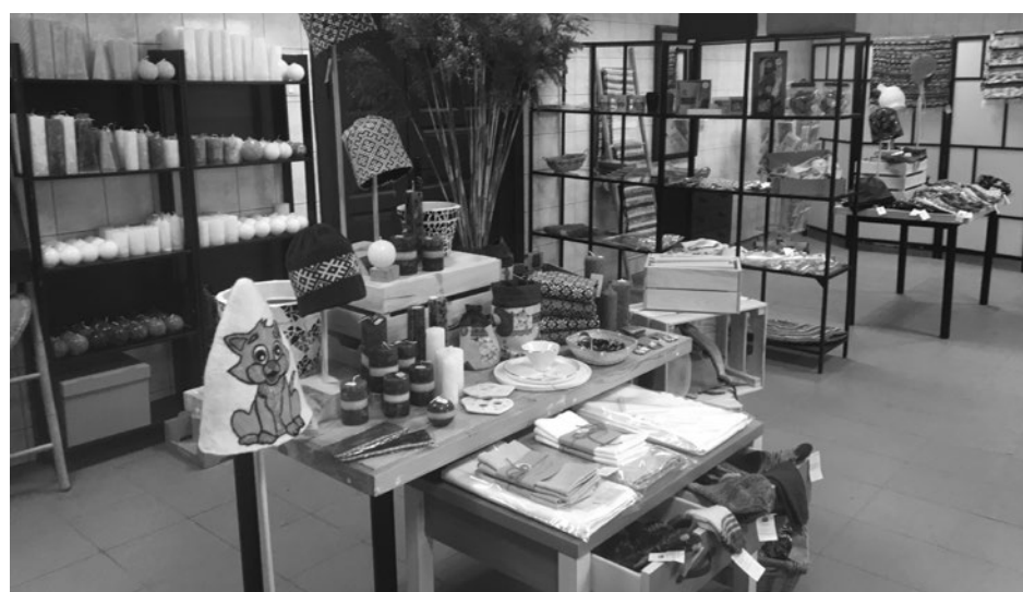
Turpinot attīstīt sociālo uzņēmējdarbību un veicinot personu ar invaliditāti nodarbinātību, biedrības "Cerību spārni" sociālais uzņēmums "Visi var" Siguldā atvēris jau otro labdarības veikalu.

Sociālais uzņēmums SIA "Visi var" dibināts 2018. gadā ar mērķi veicināt personu ar invaliditāti nodarbinātību.