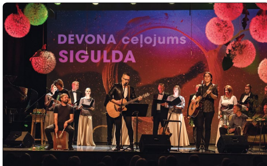
Ar četriem krāšņiem pasākumiem, kurus vieno četras mākslas formas – literatūra, māksla, mūzika un deja –, atklāta kultūras centra "Siguldas devons" ceturrtā sezona. Arī šosezon pasākumu apmeklētājiem būs iespēja daudzveidīgi atpūsties un gūt iedvesmu dažādos notikumos. Aicinām sekot līdzī informācijai par aktuālajiem kultūras pasākumiem timeklā vietnē www.sigulda.lv .