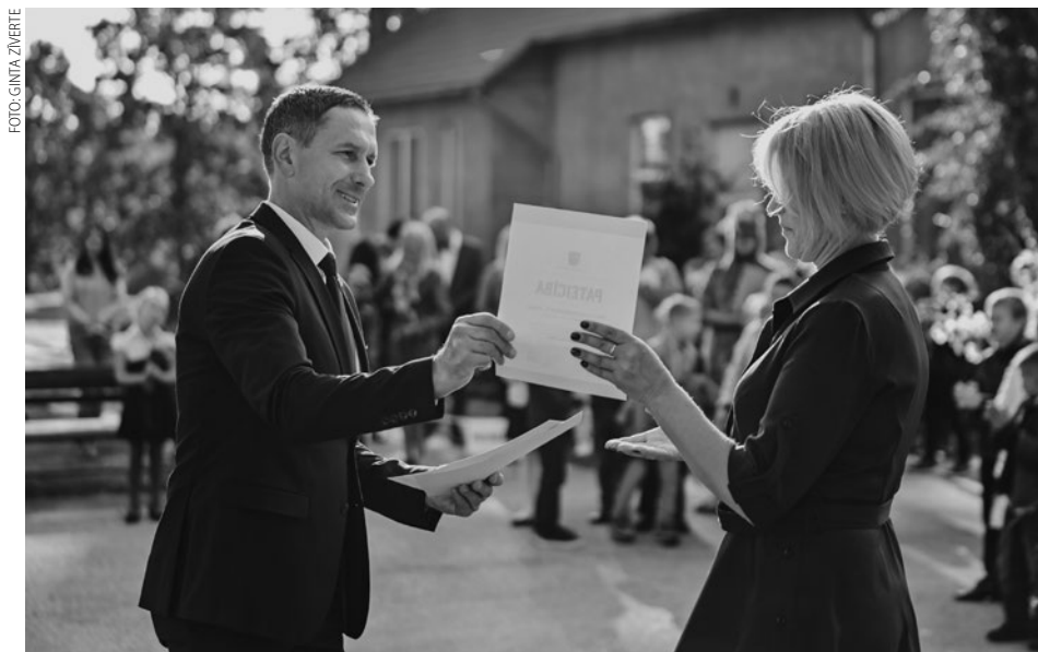
Zinību dienas svinīgajos pasākumos tika sveiktas arī tās klases, kas iepriekšējā mācību gadā izcīnīja titulu "Gada klase", pierādot sevi kā aktīvākos un atbildīgākos novadniekus un popularizējot savu skolu un novadu.

Talantīgāko un apņēmīgāko skolēnu izglītošana turpināsies arī sešās profesionālās ievirzes izglītības iestādēs – mākslu skolā "Baltais flīģelis", Siguldas Sporta skolā, Inčukalna Mūzikas un mākslas skolā, Krimuldas Mūzikas un mākslas skolā, Mālpils Mūzikas un mākslas skolā, kā arī Maijas Pilāgas Lēdurgas mākslas skolā. Tāpat skolēniem ir iespēja apgūt daudzveidīgu interešu izglītības programmu piedāvājumu gan savā skolā, gan Siguldas novada Jaunrades centrā, gan citās izglītības iestādēs.