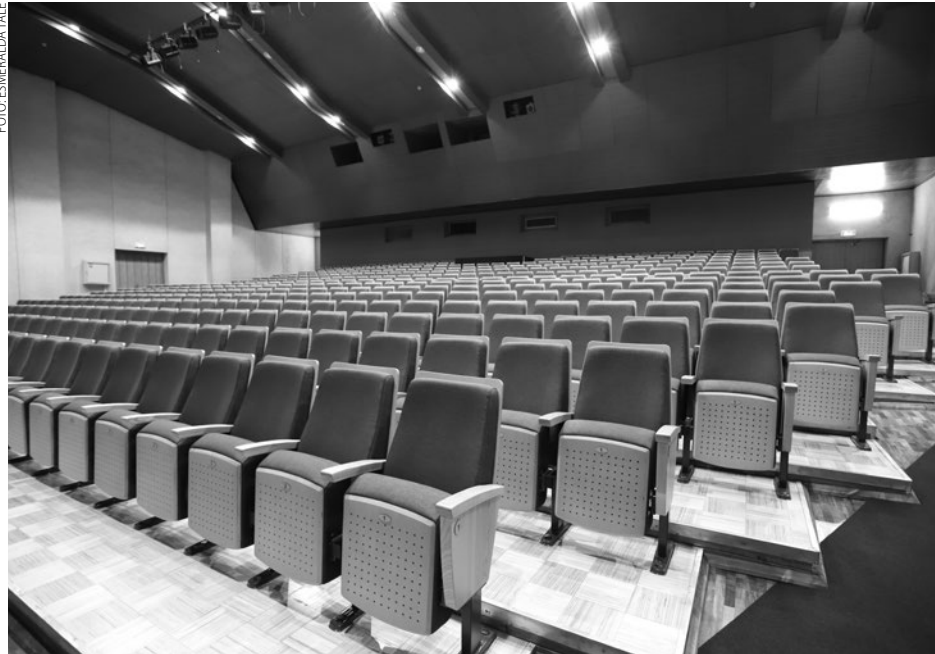
Mālpils Kultūras centra Lielās zāles atjaunošanā ar savu ziedojumu varēja iesaistīties arī iedzīvotāji un vietējie uzņēmumi. Tie ziedotāji, kuru ziedojuma summa bija līdzvērtīga viena krēsla vērtībai, uz tā varēja iemūžināt savu vārdu.

Projekts īstenots ar Mālpils novada pašvaldības atbalstu un pateicoties uzņēmēju un privātpersonu ziedojumiem. Kopējās izmaksas bija 72 656 eiro, no kuriem 16 781 eiro bija ziedojumi, 55 875 eiro – pašvaldības budžeta līdzekļi.