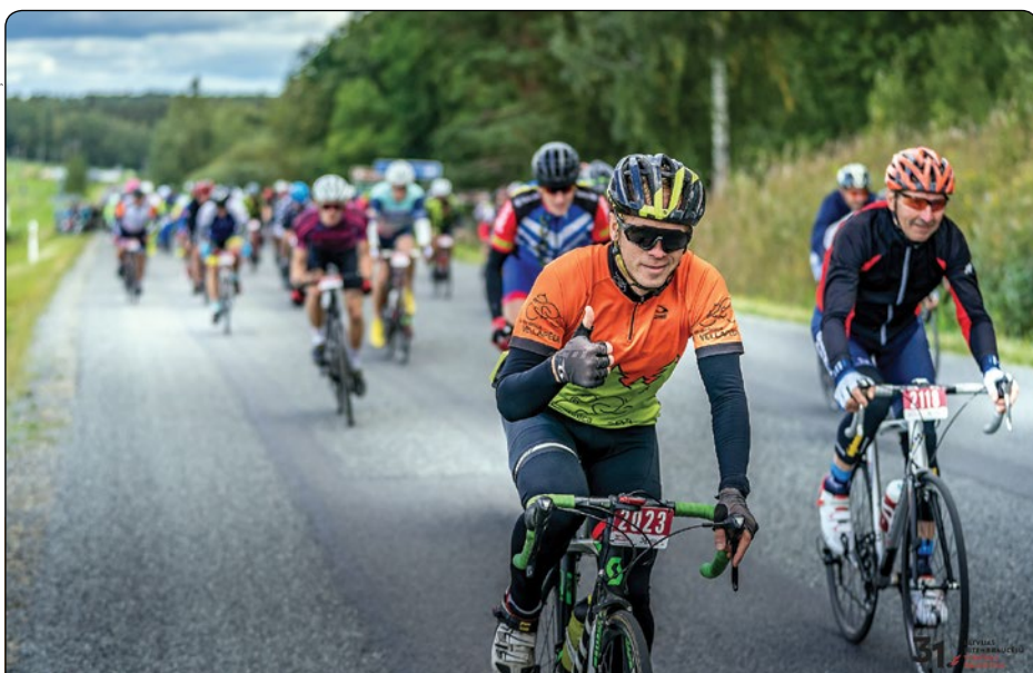
Septembra sākumā Krimuldā norisinājās tradīcijām bagātais Latvijas riteņbraucēju Vienības brauciens, vienojot velobraukšanas cienītājus no Latvijas, Lietuvas un Igaunijas. Lielākie velosvētki šogad norisinājās jaunā vietā – Krimuldā – un līdz ar to riteņbraucējus veda arī pa jauniem maršrutiem.