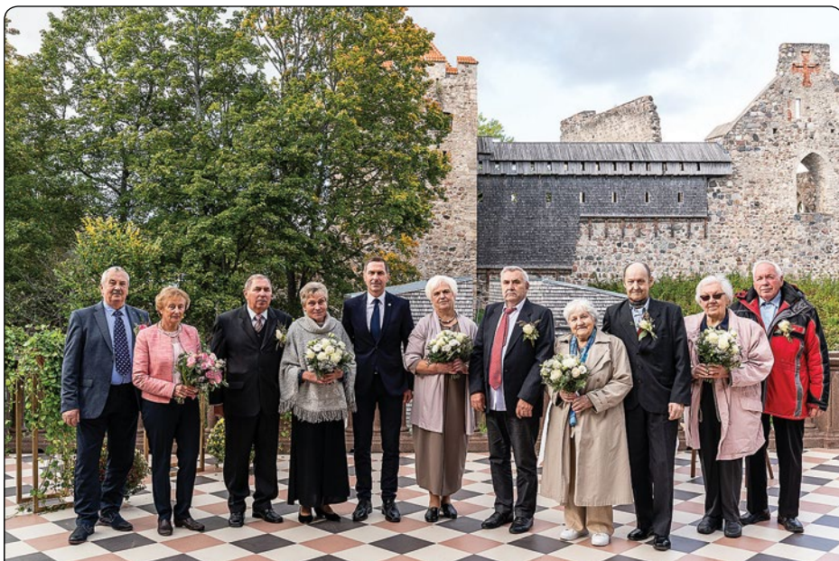
Siguldas Jaunās pils terase septembra vidū kļuva par skaista notikuma norises vietu, pulcējot pārus, kuri aizvadītajā gadā svinēja zelta kāzu jubileju. Sveicot nozīmīgajā notikumā, pāriem tika pasniegta atjaunota laulības apliecība, Latvijas Bankas izdotā sudraba monēta "Sigulda", kā arī dekoratīvs šķivis, kurš nes preču zīmes "Radīts Siguldā" apliecinājumu. Plašāka informācija 7. lappusē.