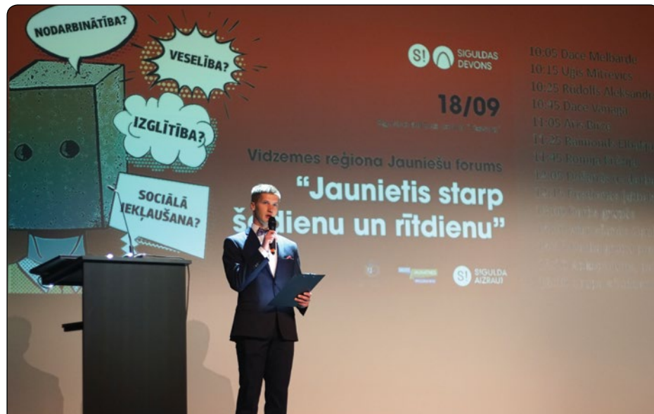
18. septembrī kultūras centrā "Siguldas devons" aizvadīts Vidzemes mēroga jauniešu forums "Jaunietis starp šodienu un rītdienu", kurā piedalījās jaunieši, jaunatnes jomā strādājošie un dažādu nevalstisko organizāciju pārstāvji no Vidzemes novada. Forumā tika aktualizēti dažādi jautājumi par notiekošo jaunatnes jomā, aicinot jauniešus saskatīt iespējas attīstīt sevi, lai nākotnē spētu iesaistīties, pielāgoties un kļūt par pieaugušajiem ar pievienoto vērtību.