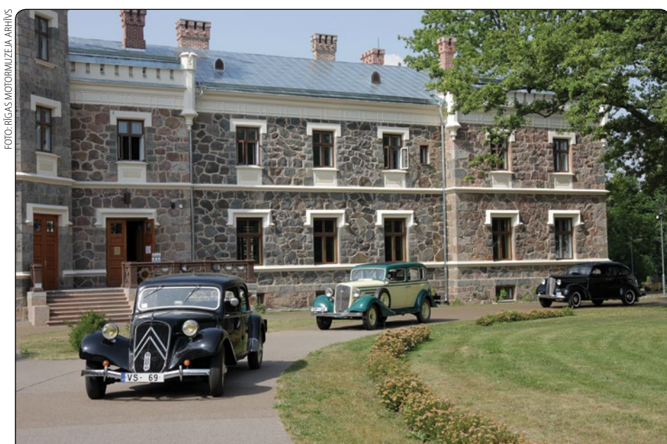
Rīgas Motormuzejs veido akciju, kurā dodas tuvāk saviem apmeklētājiem un ar retro automobiļiem priecē iedzīvotājus dažādās pilsētās. Par vienu no pieturvietām Rīgas Motormuzejs izvēlējās arī Siguldā, – pie pilsētas dzelzceļa stacijas laukuma iedzīvotājiem bija iespēja izpētīt retro automašīnas, kā arī doties izbraucienā gar Siguldas Jauno pili.