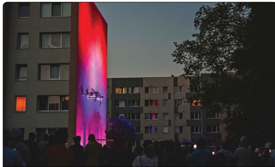
3. jūlijā Siguldas pagasta Kultūras nama apkārtnē norisinājās Apkaimes svētki, kuru laikā vietējiem iedzīvotājiem un viesiem bija iespēja iepazīties ar kaimiņiem, vietējiem uzņēmējiem un līdzdarboties dažādās aktivitātēs – apskatīt daudzveidīgas izstādes un performances, piedalīties izzinošā orientēšanās spēlē, futbola un volejbola paraugtreņiņos, kā arī Siguldas pagasta Kultūras nama amatiermākslas kolektīvu sezonas pēdējos mēģinājumos. Īpašais piedāvājums svētkos bija virvju dejas performance uz mājas sienas.