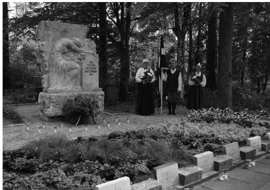
Tēlnieka Kārļa Zāles veidotajā akmens pieminekli attēlota sērojoša māte ar rožu klēpi. Šī ir piemiņas vieta, kur atceras un godina sarkanarmijas upurus, kas gājuši bojā, cīnoties par savām dzimtajām mājām un zemi.