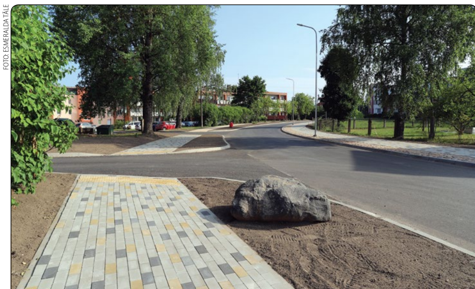
Drīzumā tiks pabeigta Jaunās un Krasta ielas rekonstrukcija Mālpils pagastā. Ceļu pārbūves laikā pilnībā izbūvēta slēgta lietus ūdens novadišanas sistēma, ūdensvada un kanalizācijas trases pārbūve, uzstādīti jauni apgaismojuma stabi. Izbūvēti gājēju ceļi un autostāvvietas, uzklāts horizontālais ceļa marķējums, kā arī drīzumā noslēgsies žoga izbūve gar bērnu dārzu "Māllēpīte".