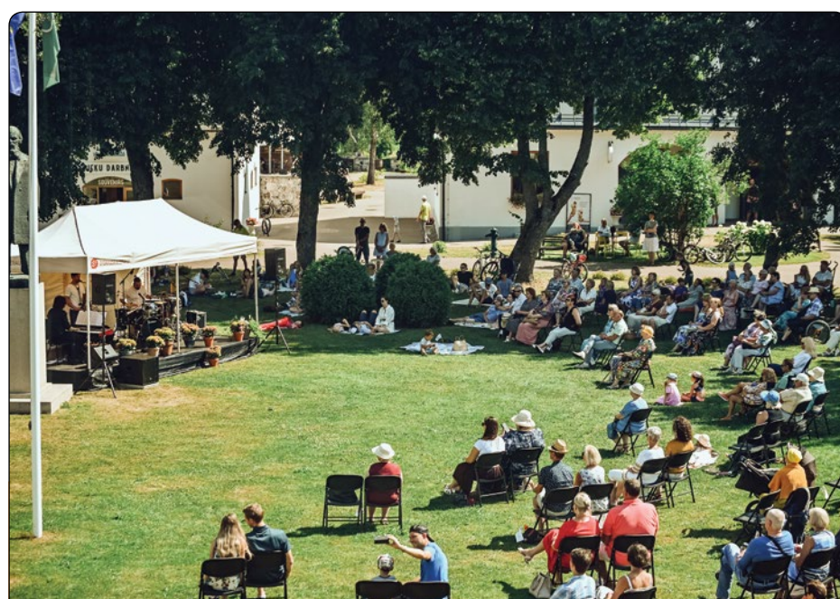
Arī šogad jūlijā Siguldas Jaunās pils dārzā notika novadnieku iemīļotās Muzikālās brokastis. Šogad par muzikālo noformējumu un performanci nespēdīgajos svētdienas rītos rūpējās studija "Knīpas un Knauķi", muzikālā apvienība "Xylem trio", kā arī "Grupa Lupa".