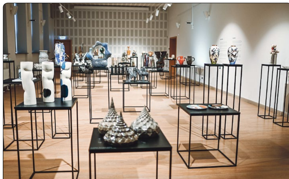
Kultūras centrs “Siguldas devons” vēris durvis apmeklētājiem, piedāvājot apskatīt unikālu laikmetīgās keramikas darbu izstādi “Satikšanās”. Izstādē vienviet iespējams iepazīt turpat 50 Latvijas mākslinieku un studentu darbus to daudzveidībā, apskatot sikplastiku, apgleznotu porcelānu, nacionālo mantojumu un pat lielzēma vides keramiku. Plašāka informācija – 5. lappusē.