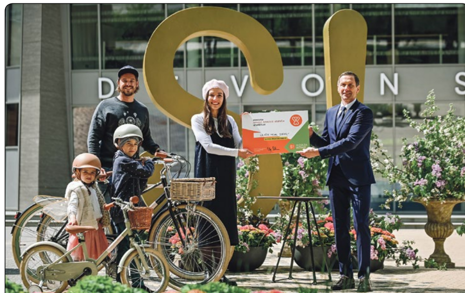
Siguldas svētku laikā individuāli tika sveikti gan jaudīgākie aizvadītā gada uzņēmēji, gan konkursa “Māmiņa. Siguldiete. Uzņēmēja” laureātes, kuras ar iegūto konkursa finansējumu varēs uzsākt vai attīstīt savu uzņēmējdarbību. Jāpiemin, ka pavasarī Siguldas novada pašvaldības dome saņēma Latvijas Sieviešu nevalstisko organizāciju sadarbības tīkla Dzimumu līdztiesības balvu, kas piešķirta, atzīnīgi novērtējot grantu konkursu “Māmiņa. Siguldiete. Uzņēmēja”. Plašāka informācija – 6. lappusē.