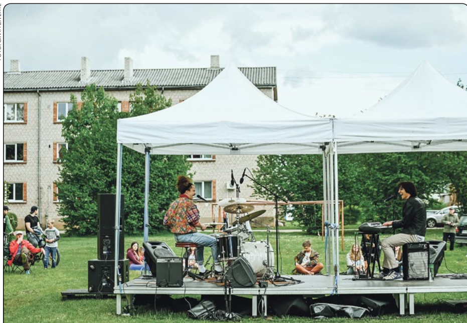
Latvijas Mīlētākā pilsēta – Sigulda – 29. maijā, meklējot jaunas svētku svinēšanas formas, ar moto “PIE-DŽĪVO-JUMS” svinēja pilsētas svētkus. Novadnieki un pilsētas viesi svētku sajūtu radīja mūzikā, garšās, pagalmos, upes krastos un radio, pārsteiguma sveicienos, azartiskos rēbusos un virtuālā, tomēr varenā kopā būšanā.