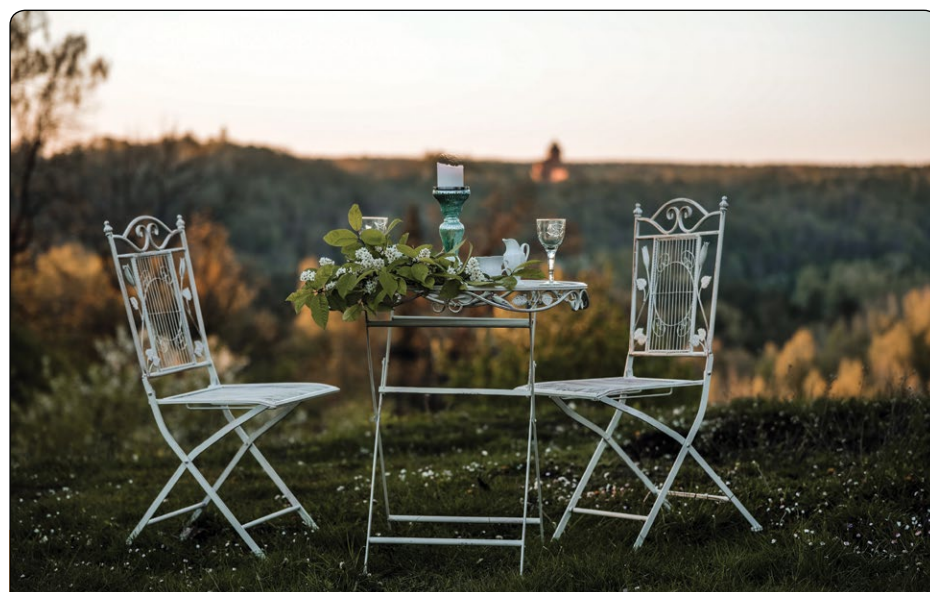
Livonijas ordeņa Siguldas pils teritorijā katru dienu no plkst. 12.00 līdz 20.00 darbojas Siguldas brīvdabas restorāns, kurā novadnieki un pilsētas viesi var mieloties ar līdzpaņemto vai Siguldas pilsētas uzņēmēju piegādāto maltīti, ko var izvēlēties tīmekļa vietnē www.restorani.sigulda.lv . Ikviens aicināts atbalstīt vietējos uzņēmējus – izvēlēties brokastis, pusdienas vai vakariņas no savējo radītā un gādātā, iekārtoties pie galdiņa pilsdrupu ielokā, pasūtīt labāko no Siguldas 14 restorāniem un izbaudīt mirkli.