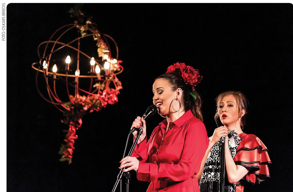
Laikā, kad ierastais pasaules ritms apstājās un ceļošana bija jāatliek uz nezināmu laiku, kultūras centrs "Siguldas devons" aizsāka jaunu mazās formas klātienēs pasākumu ciklu "Devona ceļojums", aicinot doties improvizētos ceļojumos uz dažādiem kultūras galamērķiem. Pirmais eksperimentālais ceļojums veda uz kaislīgo Spāniju, otrais – uz romantisko Franciju.