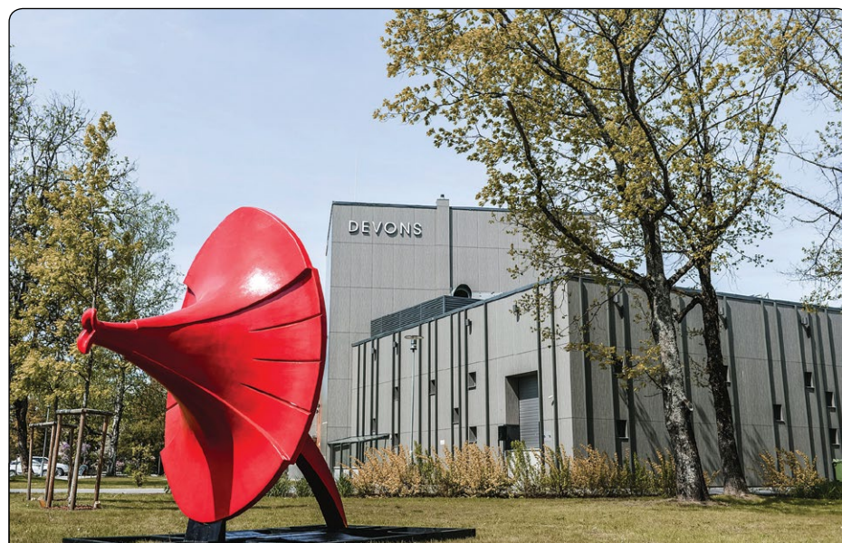
Pie kultūras centra "Siguldas devons" Raiņa ielas pusē atklāti novadnieces, tēlnieces Solveigas Vasiļjevas mākslas objekti no cikla "Jaunās eksistences formas". Lielformāta mākslas darbi "Skūpstis" un "Viesis" pie kultūras centra "Siguldas devons" veidos laikmetīgās mākslas teritoriju.