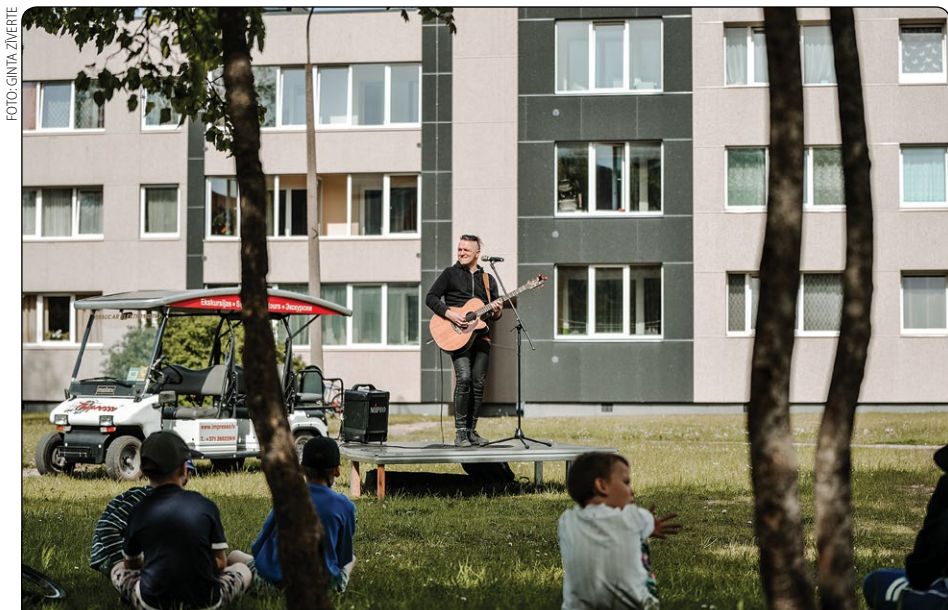
Citādi, nekā ierasts, taču ar dažādām aizraujošām aktivitātēm aizvadīti "Milētākās pilsētas svētki. Cita frekvence". Svētku sajūta novadnieku pagalmos ienāca ar pūtēju orķestru skaņām, sirsnīgiem Mūzicikla koncertiem, kuros uzstājās kultūras centra "Siguldas devons" projekta "Koncertzāle dabā" mūziķi, un radio ballīti "Radio 7" viļņos, kad kopā dziedājām "Zied ievas Siguldā".