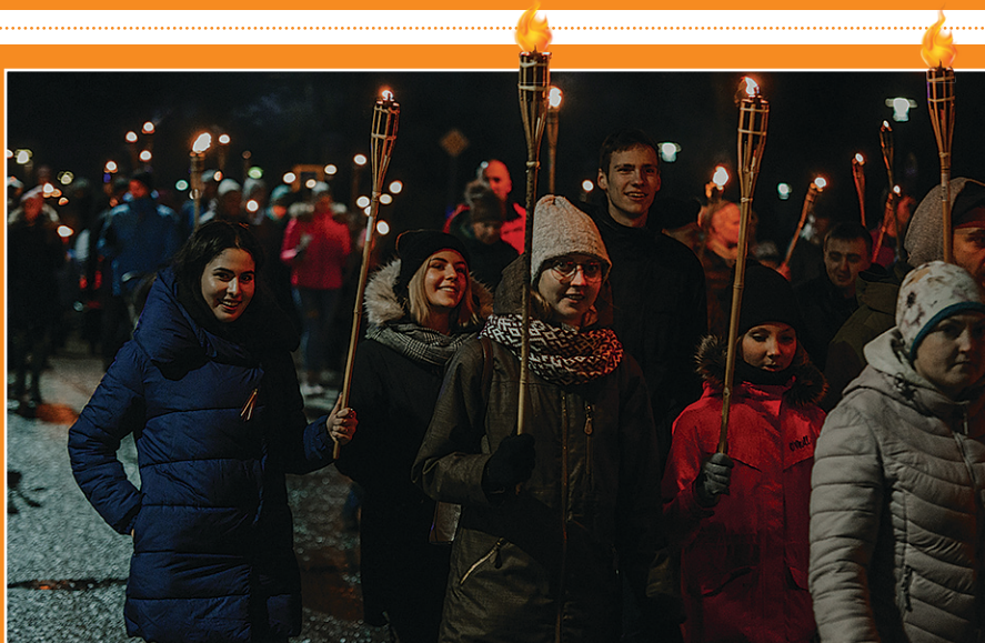
11. novembrī, Lāčplēša dienā, godinot neatkarības kara izšķirošo notikumu simtgadi un brīvības cīnītāju piemiņu, vairāki simti novadnieku devās tradicionālajā lāpu gājienā no Siguldas Svētku laukuma līdz bobsleja un kamaniņu trasei "Sigulda", kur notika monumentālā Latvijas karoga svinīgā nomaiņas ceremonija un uz ēkas sienas varēja vērot māksliniecisku gaismas veltījumu Lāčplēša dienai.