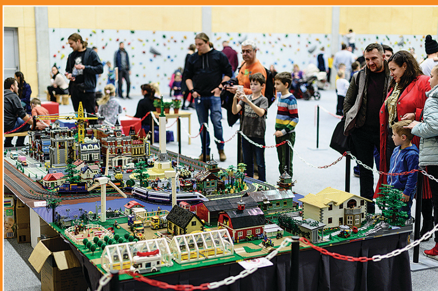
17. novembrī bērnu centrs "Kā mājās" organizēja Lego dienu Siguldā "Izzini Latviju!", kurā ģimenes ar bērniem visas dienas garumā varēja darboties ar Lego klucīšiem, piedalīties robotikas darbnīcās, kā arī priecāties par automašīnu un tehnikas modeļiem, vides objektiem, fotogrāfijām un pat veselu pilsētu no Lego klucīšiem. Robotikas meistarības klasēs piedalījās vairāk nekā 250 bērnu.