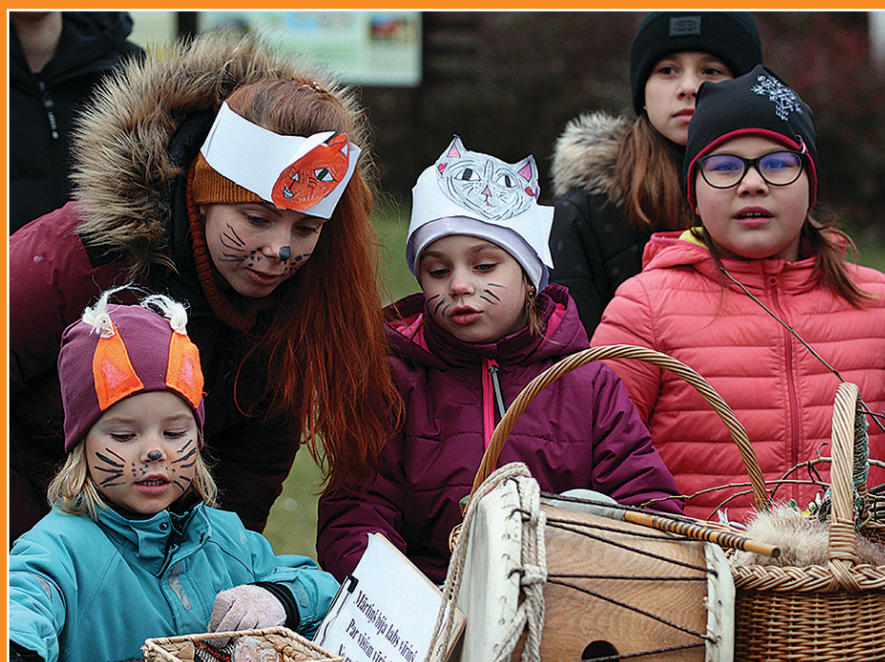
Turaidas muzejrezervātā Mārtiņdienu, kā allaž, tika aizvadīta ar tradicionāliem dančiem, zupas ēšanu un masku gatavošanu.