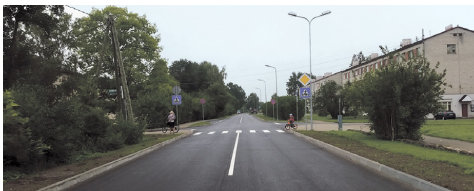
Noslēgusies Zinātnes ielas rekonstrukcija no Vidzemes šosejas līdz autoceļam P8 Inciems–Sigulda–Ķegums

Pēc vērienīgiem pārbūves darbiem noslēgusies Zinātnes ielas rekonstrukcija 1,7 kilometru garā posmā no Vidzemes šosejas līdz autoceļam P8 Inciems–Sigulda–Ķegums.