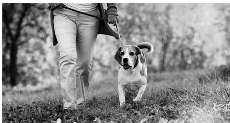
Pašvaldība atcēlusi ikgadējo nodevu par suņu turēšanu Siguldas novadā

Plašāka informācija par noteikumiem, kas nosaka nepieciešamību līdz 2017.gada 1.janvārim suni reģistrēt Lauksaimniecības datu centra datubāzē, pieejama interneta vietnē www.ldc.gov.lv.