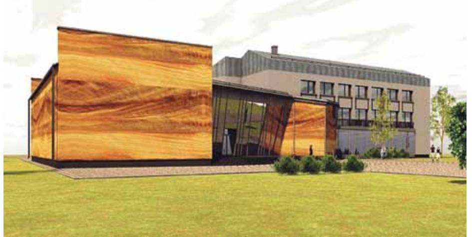
Siguldas novada Kultūras centra rekonstrukciju 7,7 miljonu eiro apmērā plānots pabeigt 2017.gada beigās

Plānots, ka Siguldas novada Kultūras centra rekonstrukcija tiks pabeigta 2017.gada nogalē.