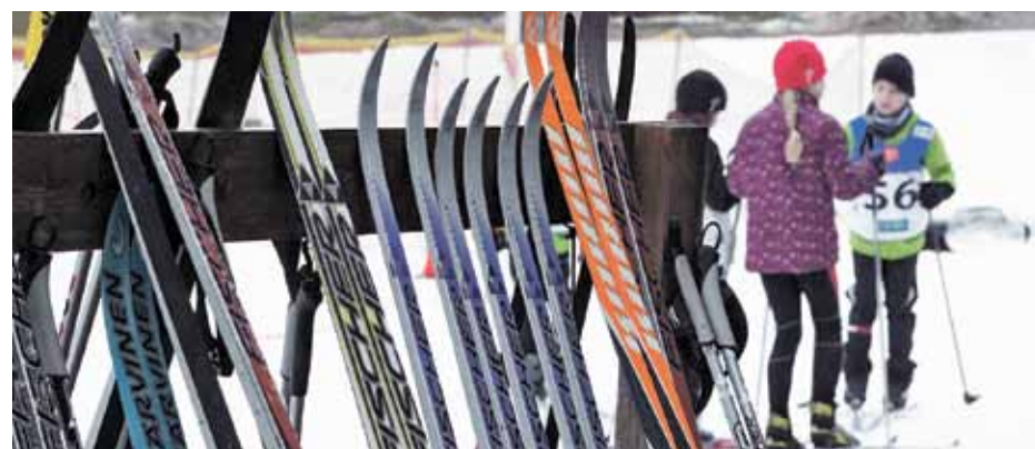
Pašvaldība palielinājusi novada skolu sporta inventāra fondu par vairāk nekā 100 distanču slēpju pāru

Šogad par 106 distanču slēpju pāriem palielināts skolu slēpju fonds – šoziem novada skolām būs pieejami vairāk nekā 300 slēpju komplektu, kas paredzēti skolēnu sporta nodarbībām ziemā Siguldas Sporta un aktīvās atpūtas centrā un skolās. Arī šajā ziemā, iestājoties piemērotiem laikapstākļiem, pie Siguldas novada skolām tiks izveidotas distanču slēpošanas trases.