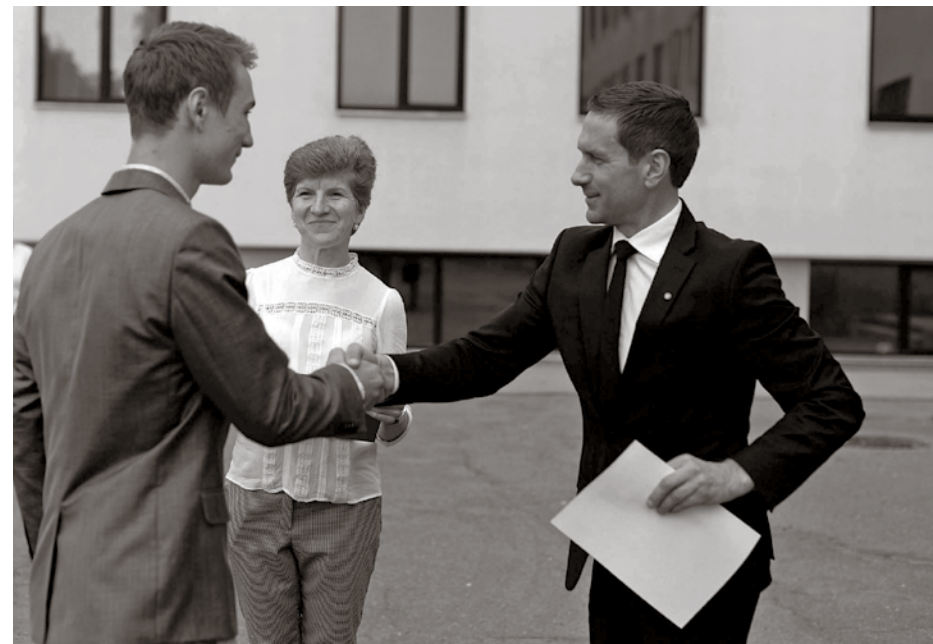
„Siguldā novada Gada klases 2015” sveikšana Siguldā Valsts ģimnāzijā