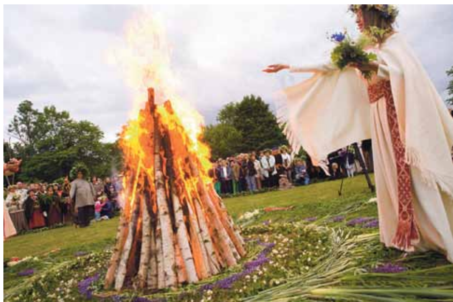
Vasaras saulgriežu svētki Turaidas muzejrezervātā