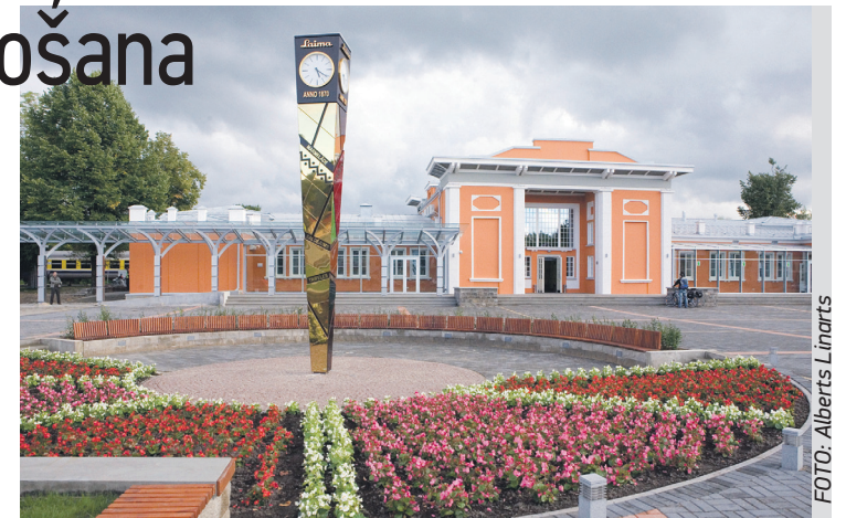
1.septembrī atklātā Siguldas dzelzceļa stacijas ēka, laukums un Laimas pulkstenis.