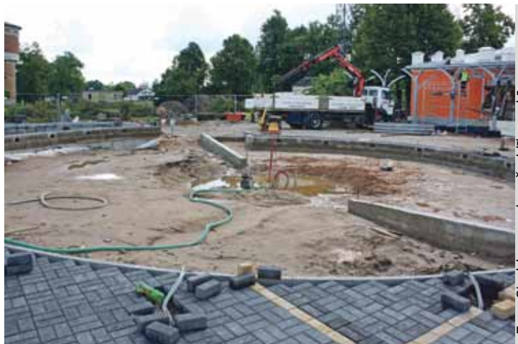
Šajā pazeminājumā dzelzceļa stacijas laukumā atradīsies AS „Laima” dāvinātais pulkstenis, kuru Siguldas novads saņēma kā balvu, iegūstot titulu „Mīlestības pilsēta”.

Nupat noslēgsies Siguldas pilsētas kultūras nama Mazās zāles rekonstrukcija – sakārtota apkures sistēma, veikts kosmētiskais remonts, griestu seguma un apgaismojuma uzstādīšana, sakārtotas komunikācijas, izveidots interneta pieslēgums, kā arī atjaunota parketa grīda. Zālē tiks uzstādīts izstāžu organizēšanai nepieciešamais aprīkojums un nomainītas ieejas durvis. Drīzumā Siguldas pilsētas kultūras nama telpās tiks pabeigta konsultāciju punkta izbūve, kas atradīsies blakus Kinozālei. Konsultāciju punktā darbosies administrators, kura uzdevums būs veicināt uzņēmēju sadarbību, kā arī sniegt konsultācijas dažādos uzņēmējdarbības jautājumos. Tāpat tiks veikts arī kultūras nama vestibula kosmētiskais remonts, lai jau rudenī kultūras mīļotājus sagaidītu labiekārtotās telpās. ☺