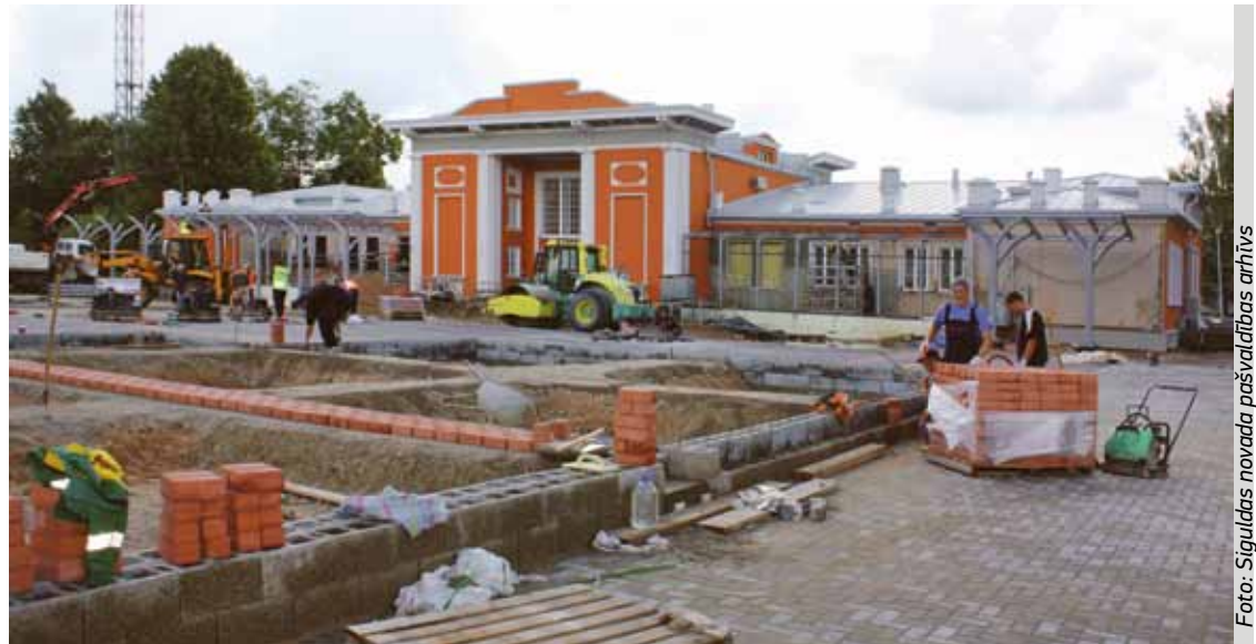
Būvniecības darbus plānots pabeigt līdz 1.septembrim.

Bērnodārza „Pīlādītis” korpusā, kurā agrāk atradās Siguldas novada bibliotēka, tiek izbūvētas telpas divām jaunām grupiņām, kuras paredzētas 48 bērniem. Būvdarbus veic uzņēmums „TTT Plus”, un darbu grafiks tiek ievērots līgumā noteiktā kārtībā.