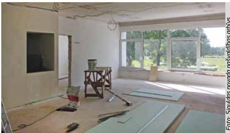
Pirmsskolas izglītības iestādē „Pīlādītis” jau veikta baltā apdare, drīzumā notiks telpu krāsošana pasteltoņos.

sedz 90%. Projekta ietvaros tiks izveidots bērnu spēļu un atpūtas laukums Jaunatnes ielā 1a, tiks uzstādīti rotaļu rīki un labiekārtota teritorija ap spēļu laukumu. Šobrīd ir noslēgsies iepirkuma procedūra un uzsākti pirmie teritorijas labiekārtošanas darbi. ☺