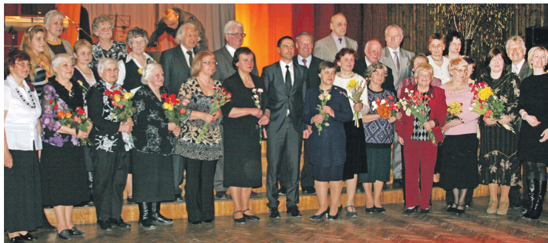
Pateicības balvu saņēmēji – Siguldas novada pašvaldības Sociālā dienesta Dienas centra nevalstisko organizāciju vadītāji un aktīvisti kopā ar pašvaldības vadību.

tik aktīvi ļaudis. Un pierādījums tam ir šūniņas, grupas, biedrības, dibinājumi un nevalstiskās organizācijas, kurās jūs tiekaties. Nākot kopā, jūs paveicat ļoti lielu un svarīgu darbu, kas dod enerģiju,