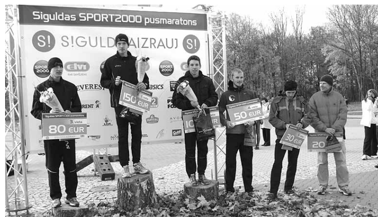
Siguldas "Sport2000" pusmaratona uzvarētāji absolūtajā vīriešu konkurencē.

Informāciju sagatavoja Kaspars Kārklīšs un Ilze Ratniece