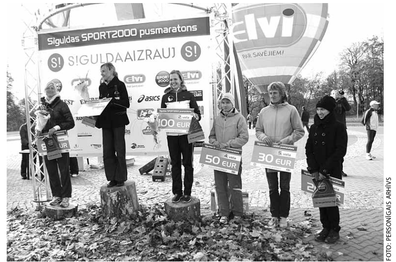
Siguldas "Sport2000" pusmaratona uzvarētājas absolūtajā sieviešu konkurencē.

policijas, gan Siguldas novada Pašvaldības policijas darbinieki. Sacensību norisē tika iesaistīti arī brīvprātīgie jaunieši no Siguldas Sporta skolas. Paldies viņiem par atsaucību.