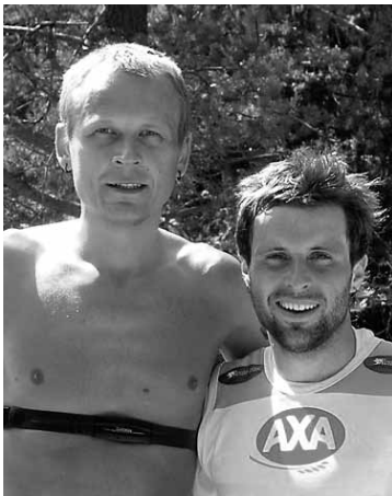
Brašie "Siguldas tilti" skrējēji finišā +30 grādu svelmē.

11. jūnijā Siguldā, Serpentina ceļa pakājē, jau piekto reizi notika tradicionālais Siguldas tiltu skrējiens. Sacensībās ik gadu piedalās gan profesionāļi, gan iesācēji, kā arī ģimenes ar bērniem.