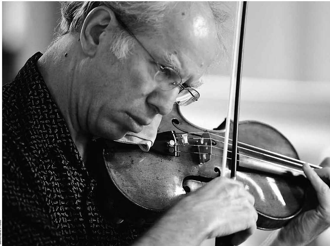
Gidons Krēmers caur mūziku aicina sajūst jaunību un būt jauniem.

Šī gada festivāla ideju un koncepciju Gidons Krēmers skaidro: "Jaunība, manuprāt, ir mūžīga. Lai atceramies kaut vai Rodēna brīnišķīgo darbu "Mūžīgais pavasaris". Jaunībai nav ne laika, ne stila robežu. Šogad mēs gribam pievērsties jaunajiem mūziķiem un mūzikai, kas rakstīta (par un ar) jauniešiem, bērniem un lielo komponistu agrīnajiem opusiem. Mēs atzīmējam Imanta Zemzara jubileju, jo arī viņš savā mūzikā paliek vienmēr un negaidīti jauns. "Kremerata Baltica", kam nākamgad būs jau piecpadsmit, ar visu savu pieredzi tik un tā paliek "pusaudzis", un ar tās godīgo un entuziasma pilno muzicēšanu es pats arī jūtos jaunāks. Cerēsim, ka mūsu koncertu klausītāji varēs izjust mūziku kā dvēseles terapiju, ar kuru vecums gaist un gribas elpot brīvāk, raudzīties apkārt gaišāk, neskaitot savus gadus. Tād mums – kā bērniem – dzīvesprieks būs stiprāks par visām sāpīgajām problēmām. Mūsu festivāla mērķis ir "Atjaunotne" S!