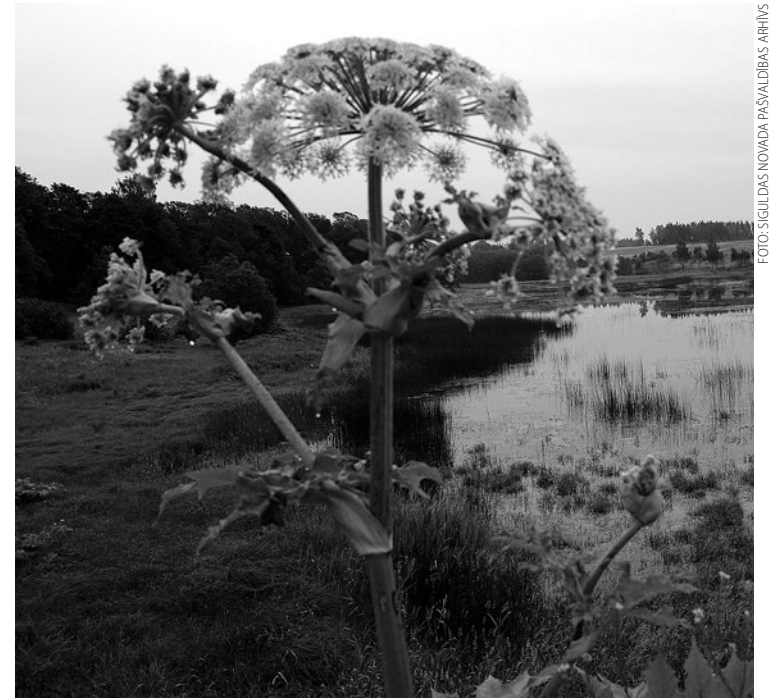
FOTOSIGULDAS NOVADA PAŠVALDĪBAS ARHĪVS

Pēc VAAD datiem, Siguldas novadā ar latvāņiem invadēta vairāk nekā 738 hektāru liela platība. Siguldas novada latvāņu izplatības ierobežošanas pasākumu organizatoriskajā plānā 2022.–2026. gadam iekļauta informācija par 62 zemes vienībām,