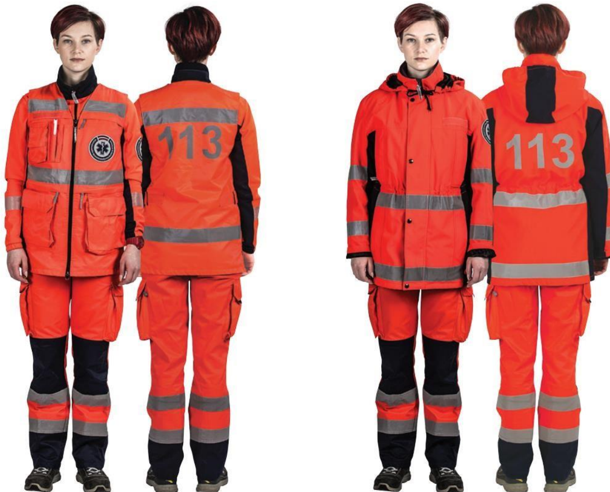
ātrās medicīniskās palīdzības darbinieks